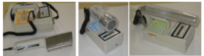
アルファ線測定器